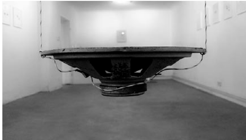
Singing , 2000. 7 Lautsprecher, Kabel, schwarzes Pigment, CD-Spieler, Verstärker, audio Galerie Thomas Bernard – Cortex Athletico / estate rolf julius