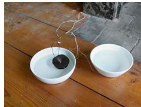
Water , 1998 2 Schalen, Wasser, 3 Lautsprecher, CD-Spieler, audio. estate rolf julius