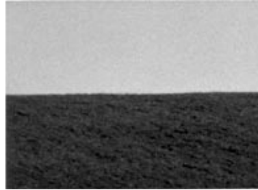
Deichlinie , 1979/80 Mehrteilige Fotografie, s/w, je ca. 17 x 19 cm

Vor dem Hintergrund von Julius' bereits klassischem Werk richtete die Kunsthalle Wilhelmshaven in Kooperation mit dem